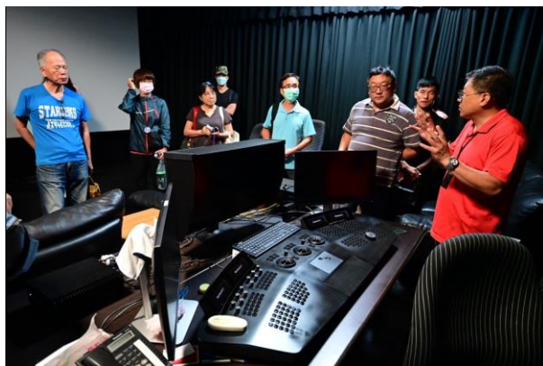
研習活動觀摩現場(8/5)