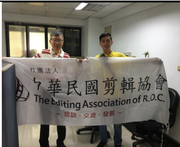
研習活動與剪輯協會段秘書合照 (8/5)