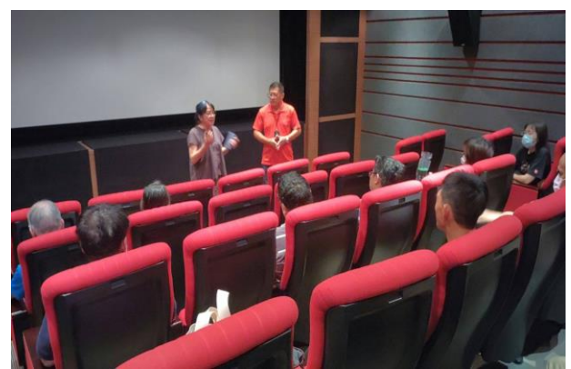
研習活動演講現場 (8/5)